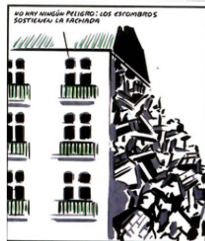
«Non c'è nessun pericolo. Le macerie sostengono la facciata.»

Quelle voci appartengono a uomini e donne mute, antesignane dell'astensionismo. Da molto non hanno rappresentanza. Ognuno a loro modo opera per estendere quello spazio occulto affinché divenga forza comune. Parlano con circospezione di spiritualità, sanno che può essere facilmente fraintesa. Evitano di citare che stanno solo cavalcando le vie già tracciate dai Maya, dai Toltechi, dagli Egizi, dal Buddismo, dalla Kabbalah e da altre tradizioni tra cui il Cristianesimo, quello vero non quello posticcio, populista, superficiale appunto che la religione ci ha fatto conoscere. Sanno che per qualcuno, siccome non si può toccare, siccome la scienza dice che non c'è, non esiste, non è misurabile, è un tabù, meglio non toccarlo. Siccome non lo dice il metodo, né la regola, non va bene. Sanno che sono quelli che risolvono la questione accusando di ciarlatanismo a destra e a manca. Lo fanno serenamente, hanno tutta la loro famiglia culturale a proteggerli. Eppure, come con le diete seguite per colpa di pressioni culturali, dove, indipendentemente dai risultati, non impari nulla su te stesso, anche il metodo, che ci addestra a risposte predefinite, non permette di maneggiare la materia dei nostri limiti. Non contiene alcuna